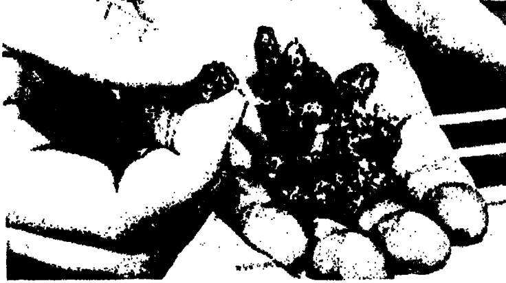
بعض الحجارة التي سقطت على منازل في بيتربي (ديرهام) يوم 21 حزيران 1980

زرقاء صافية ولم يكن هناك سوى غيمة كانت تتعد شيئاً فشيئاً . وصف السيد اوسبورن سقوط حبات البندق قائلاً : كانت ترتطم بالأرض بغزارة وتتغرز فوق السيارات . كانت تسقط من ارتفاع يمكنني أن أقول عنه أنه شاهق . جمعت منها نصف دزينة أو ما يقارب وأخذتها معي الى البيت . تذوقت إحداها فيما بعد وكانت حلوة طازجة ولذيذة جداً . وقد علم هذا الرجل أن أحد أصدقائه قد مرَّ بعد دقائق من نفس المكان وشهد أيضاً زخات البندق تلك . وتثير هذه الحادثة المثبتة والتي تؤيدها الوثائق وشهادات الشهور أسئلة كثيرة محيرة : من أين جاءت حبات البندق هذه ؟ وكيف وصلت إلى السماء ؟ والأغرب من ذلك كيف ظهرت حبات البندق الحلوة الطازجة واللذيذة في شهر آذار مع العلم أن البندق لا ينضج حتى حلول الخريف ؟! ولو افترضنا أن حبات البندق هذه هي من محصول الخريف الماضي فأين كانت منذ ذلك الوقت ؟ وهناك حادثة مشابهة جرت في دبلن في أيرلندا في شهر أيار من عام 1867 عندما سقطت كميات كبيرة من الثمار خلال عاصفة شديدة وأمطار غزيرة . وقد تبين فيما بعد أن هذه الثمار ما هي إلا حبات من البندق تحجرت في مستنقع للفحم العضوي ورغم علمنا بهذا كله لم يستطع أحد حتى الآن أن يشرح كيف سقطت حبات البندق هذه من السماء . وهناك حوادث أخرى توازي سابقتها حيرةً وغرابةً ومنها البيض الذي سقط عدة مرات على طلبة مدارس في مدينة ووكينغهام في مقاطعة بيركشاير في بداية كانون الأول عام 1974 ، وهناك أيضاً كتل الطين وجذور الأشجار والأعشاب